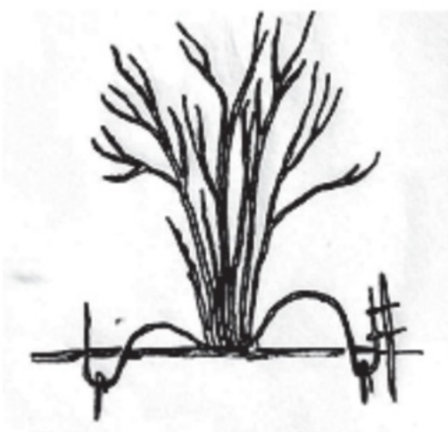
රූපය 10.3 සරල අතු බැඳීමක සැලැස්මක්