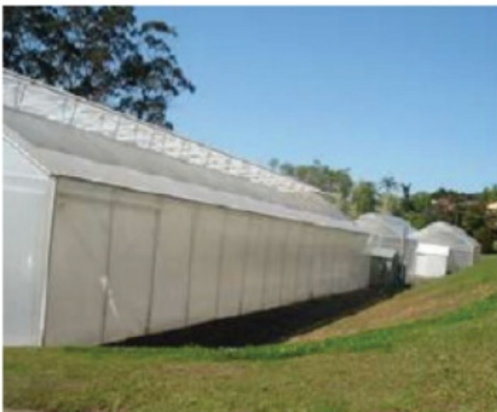
10.1 (a) රූපය ආරක්ෂිත වගාවේ ඡයාරූපයක්