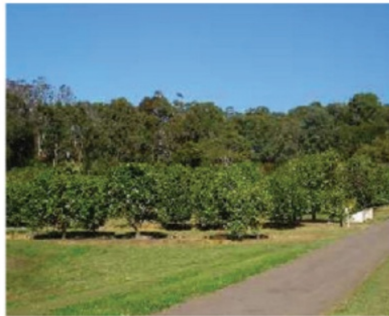
10.2 (b) රූපය විවෘත වගාවේ ඡයාරූපයක්