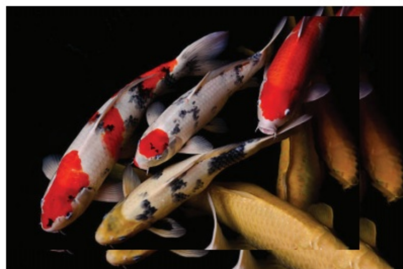
කොයි කාප් මත්ස්‍යයෝ